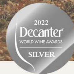
Mimetic 2022 D.O.P. Calatayud